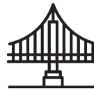
Puentes, Viaductos, etc.