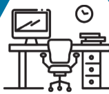
Edificaciones Institucionales y Comerciales